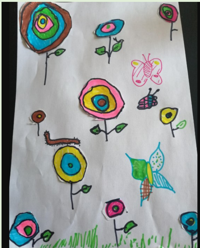
Les fleurs de Noah